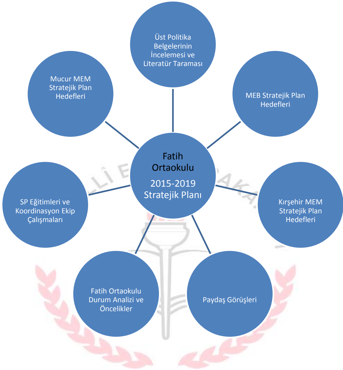
Şekil 2: Fatih Ortaokulu Stratejik Plan Oluşum Şeması

Stratejik plan hazırlık sürecinde üst kurul ve stratejik plan hazırlama ekibinin oluşturulmasının akabinde kurum/birim çalışanları ile toplantılar gerçekleştirilmiş, durum analizi yapmak üzere veriler toplanmış, paydaş anketleri, tutanaklar, öz değerlendirme raporları ve kurum öncelikleri dikkate alınarak Fatih Ortaokulu 2015-2019 stratejik planı hazırlanmıştır. Gerçekleşen çalışmalar Fatih Ortaokulu Stratejik Plan Üst Kurulu koordinesinde yürütülmüştür.