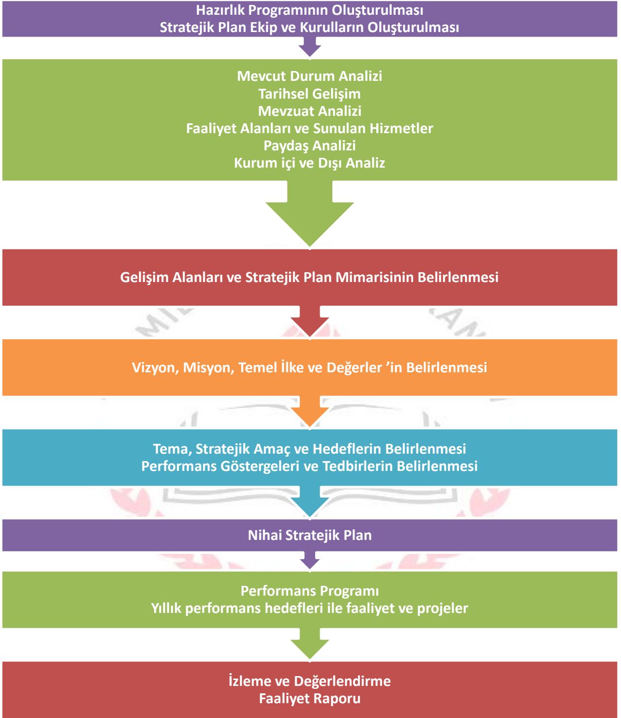
Şekil 1: Fatih Ortaokulu Stratejik Planlama Modeli